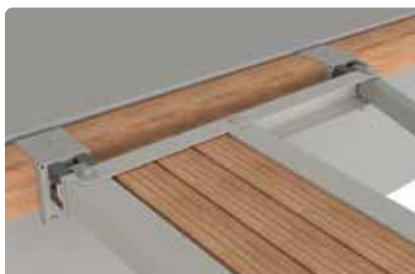
Kobling til betongbrygge.