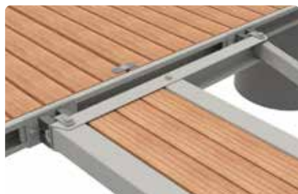
Kobling til stålbrygge.