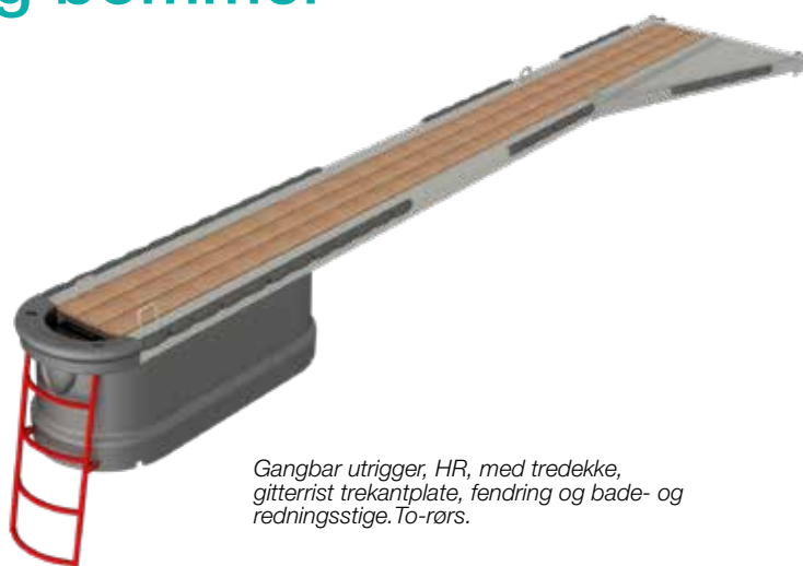
Gangbar utrigger, HR, med tredekke, gitterrist trekantplate, fendring og bade- og redningsstige. To-rørs.