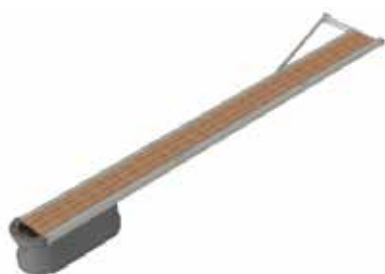
Gangbar utrigger, to-rørs