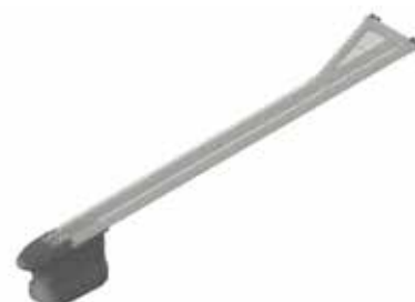
Gangbar bom, to-rørs