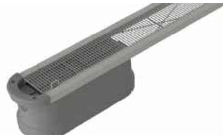
Classic utrigger med gitterristdekke.