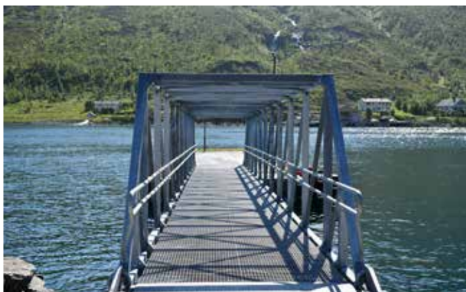
Secora AS, Sør-Tverfjord: landgang 25 m lang, 2 m bred og levert med sklisikkert, snøfritt gitterristdekke. Varmforsinket utførelse.