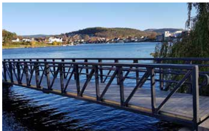
Betonmast Telemark AS: landgang 17 m lang, 2 m bred og levert med komposittdekke. Lakkert utførelse, CombiCoat® beskyttet.