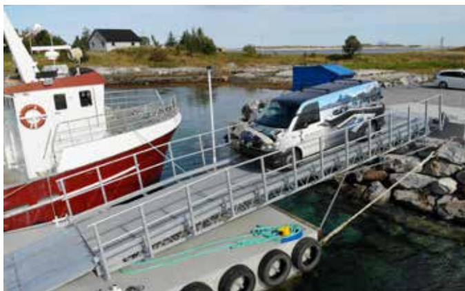
Helgeland Marinasystemer, Herøy i Nordland: kjørbare landgang 3 x 12 m med gitterristdekke. Varmforsinket utførelse.