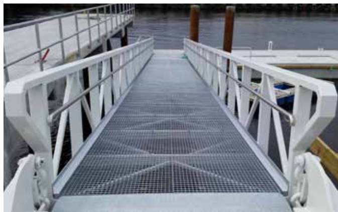
Skanska Norge AS - Brannstasjon Nyhavna: landgang 24 m lang, 2 m bred og levert med gitterristdekke. Lakkert utførelse, CombiCoat® beskyttet.