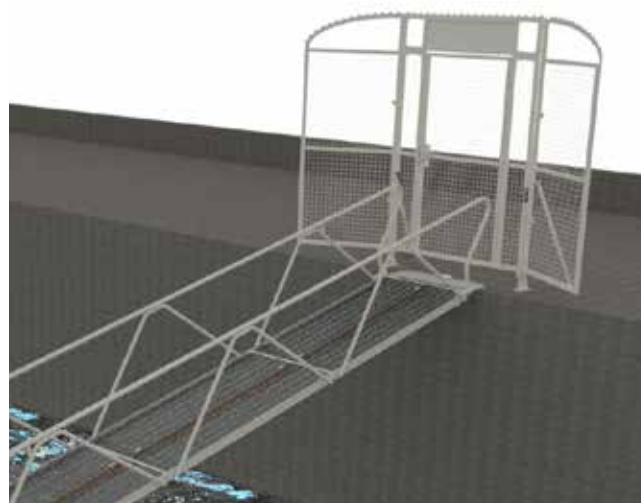
Port for montering på land.