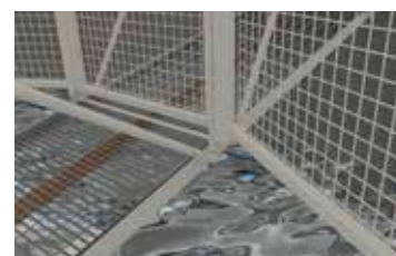
Innfestning på landgang.