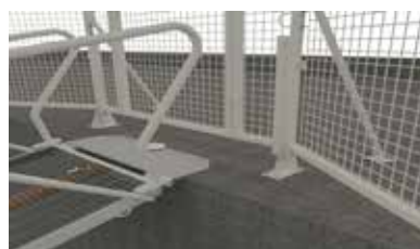
Innfestning på landfundament.