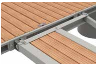
Kobling til stålbygge.