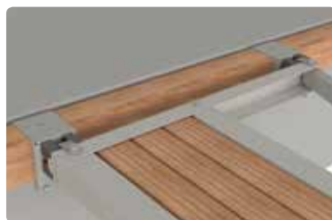
Kobling til betongbygge.