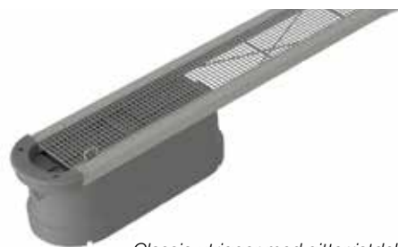
Classic utrigger med gitterristdekke.