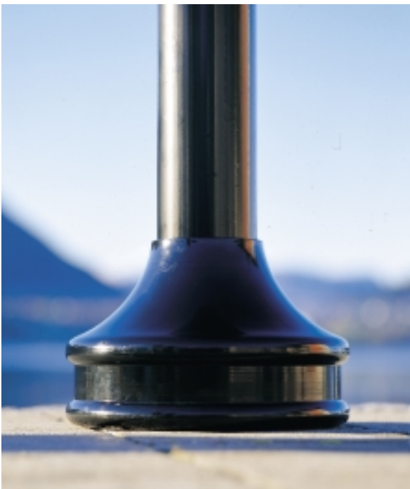
Pyntesokkel sett fra siden.