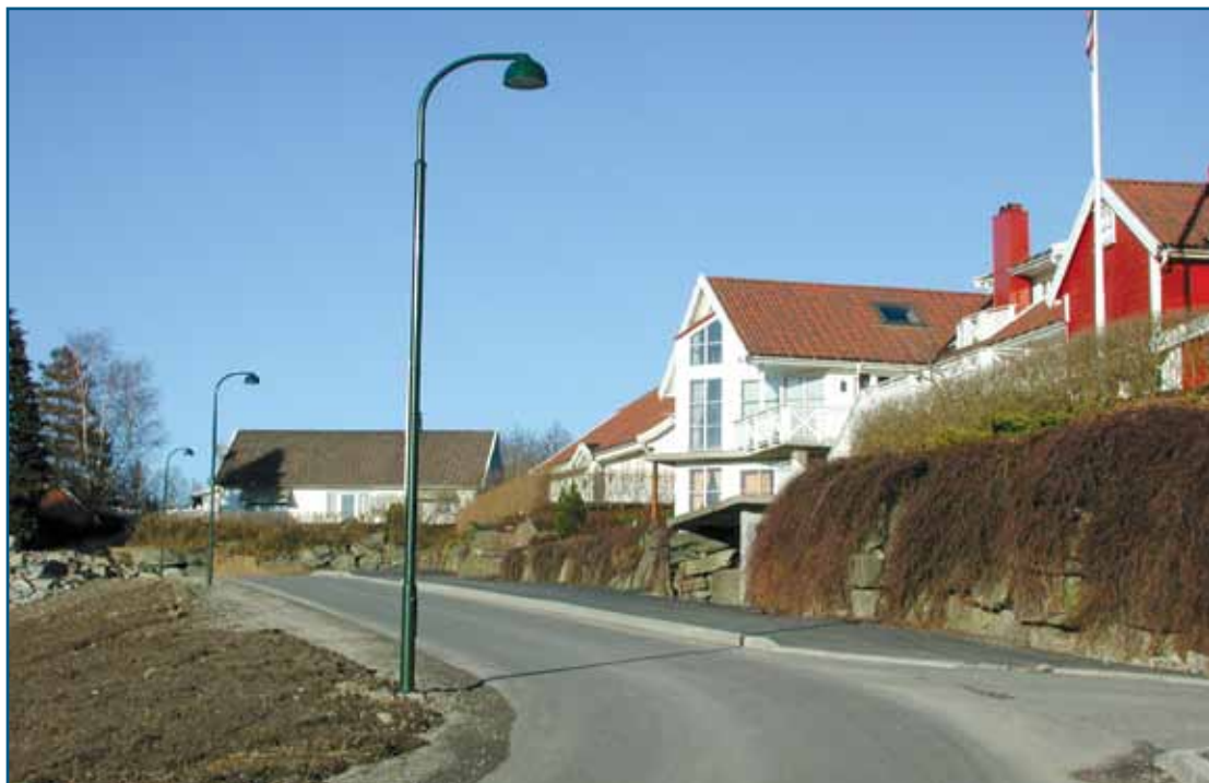
Hånesbakken i Kristiansand med Philips København armatur.