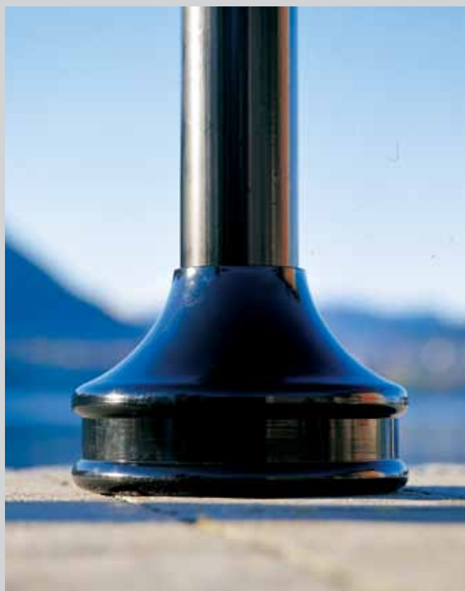
Pyntesokkelen er med på å øke det estetiske inntrykket på miljømastene.

NB! Fargeprøver er kun ment som illustrasjon, og vil avvike fra lakkleverandørens fargekart.