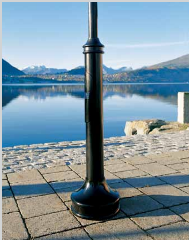
Bildet viser pyntesokkel og pyntering montert på en standard parkmast.

For mer informasjon om vårt pulverlakkbelegg, vennligst ta kontakt.